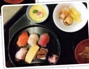
にぎり寿司セット

誕生日は一年に一度の特別な日。「誕生日に食べたい料理はありますか?」とインタビューすると『うな井定食』や『にぎり寿司セット』など思い思いのリクエストが挙げられます。誕生日当日は、調理員の手作り料理を食し終えると、「美味しかった」という言葉とともに、来年のリクエストメニューについて笑顔で話し出す姿が見られています。これからもリクエストに応えていきたいと思えます。