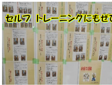
セルフ トレーニングにもぜひ