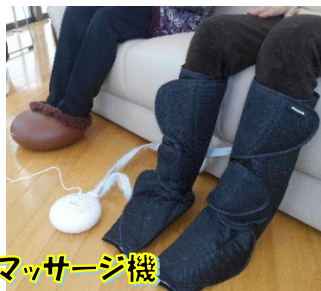
フットマッサージ機