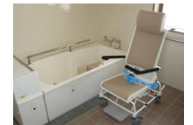
車椅子の方のために