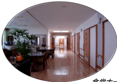
食堂ホールと廊下

居室料 27,900円 食費 36,000円 管理費 16,500円 共益費 3,000円